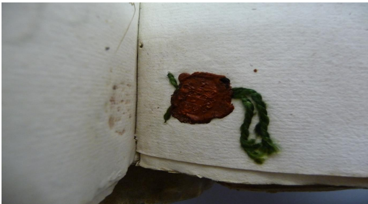
Zegel wapenschild uit één van de protocolboeken van Notaris van Eindhoven